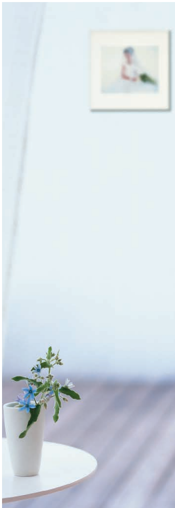
ワイドなマット幅のフォトフレーム