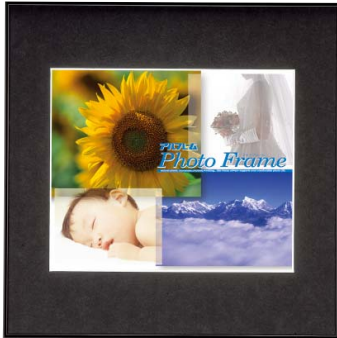
ワイドなマット幅のフォトフレーム