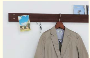
【長押ラックD30 マグネットタイプ】 長押ラックの正面木目部分がマグネットで掲示できるタイプ。