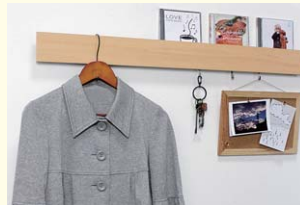
【長押ラックD30】 フック付きで小物を掛けることもできます。