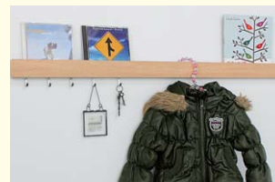
【スリム長押】 フック付きで小物整理に便利。上部にCD等の小物ディスプレイができます。