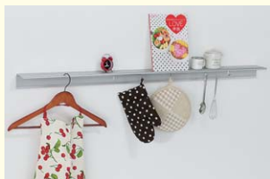
【アルミシェルフ】 上部が棚になっていて小物を置いたり、フックに掛けたりして使えるアルミのラック。