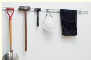
【壁掛け収納レール】 壁にいろいろな物を取り付けたり、掛けるためのレール。オプションと合わせて使えます。