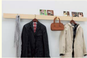
【長押ラックD50 木地タイプ】 長押ラックの表面が突板貼りで好みの色に塗装して使う木地タイプ。