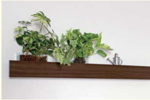
【長押ラックD50】 奥行がありCD等の小物ディスプレイとしても使えます。