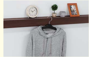
【長押棚】 上部が棚になっていて小物を置いたり、ハンガーを掛けることもできます。