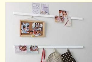
【マルチレール】 ポストカードなどを止めるクリップとフックが付いた汎用レールです。