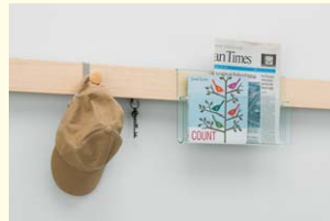
【長押ラックD30 木地タイプ】 長押ラックの表面が突板貼りで好みの色に塗装して使う木地タイプ。