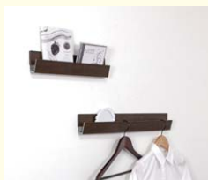
【ラインポケット】 レール式でディスプレイや小物入れとして使えます。