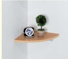
【コーナーシェルフ】 コーナー部を有効活用できる飾り棚です。ちょっとした小物置きに便利です。