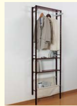
【ユニットシェルフ】 壁に取り付けて使う奥行150mmの薄型シェルフです。