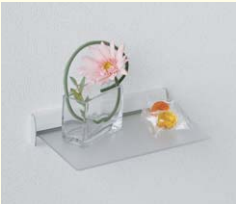
【スリムシェルフ】 アクリル板がオシャレな飾り棚です。