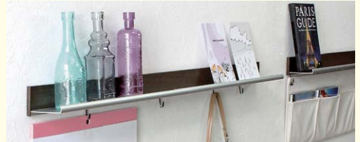
【ラインシェルフ】 フック付で便利に使える飾り棚です。