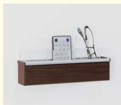
【ポケットラック】 エアコンやテレビなどのリモコン置きに便利です。壁付けと卓上で使えます。