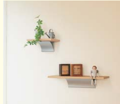
【ウッドシェルフ】 ちょっとしたディスプレイや小物置きに便利な飾り棚です。