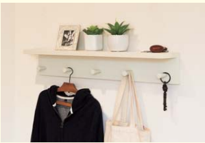
【フック付ウォールシェルフ】 棚にフックが付いているので置いたり掛けたり便利に使えます。