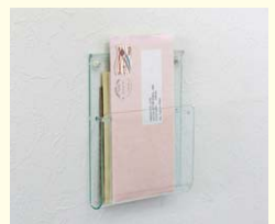
【クリアポケット】 レター整理に便利なアクリルポケットです。中身も見えて便利です。