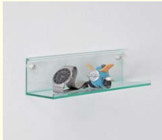
【クリアシェルフ】 シンプルなアクリル棚です。