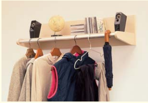
【壁付け天井ラック】 大型の棚にパイプハンガーが付いていて使い勝手がいい棚です。