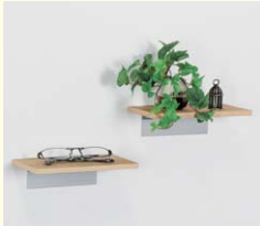
【スマートシェルフ】 簡易タイプの飾り棚です。