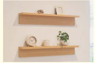
【ウォールシェルフ】 シンプルな壁付け棚です。ちょっとした壁をディスプレイスペースとして使えます。