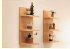
【ウォール3段シェルフ】 小物整理に便利で収納力が魅力です。