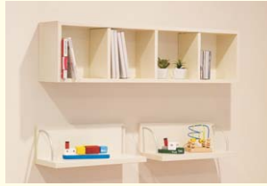
【ウォールBOX】 本やCDの整理に便利なBOX棚です。