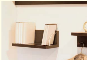
【L型ウォールシェルフ】 サイドにこぼれ止めがついた棚です。本やCDの整理におすすめです。